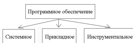
Рисунок 2 – Классификация программного обеспечения

Иллюстрации при необходимости могут иметь наименование и пояснительные данные (подрисуночный текст). Слово "Рисунок", его номер и через тире наименование помещают после пояснительных данных и располагают в центре под рисунком без точки в конце. Пример: